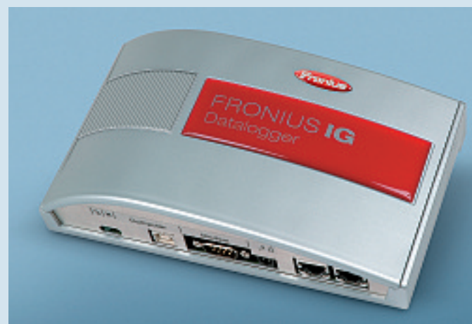
FRONIUS IG Datalogger Box

Nel sistema FRONIUS IG DatCom è possibile integrare diversi sensori. Questi consentono di dare uno sguardo più in profondità alla modalità di lavorare dell'impianto e permettono di trarre considerazioni fondate sulla performance complessiva. Questa opzione è disponibile, come al solito, come scheda ad innesto o come box. Le schede sono consigliabili in presenza di distanze fino a max. 20 – 30 m tra inverter e sensori. Distanze maggiori possono essere coperte con la box. I seguenti sensori possono essere collegati alla Sensor Box (Card): irradiazione, temperatura ambiente, temperatura modulare, contatore di energia, velocità del vento e molto altro ancora.